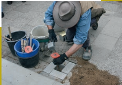
In den letzten Jahren hat der Kölner Künstler Gunter Demnig über 40.000 Stolpersteine für Opfer des Nazi-Regimes verlegt.

Auch in Kiel werden seit 2006 jährlich neue Stolpersteine verlegt.