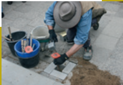
In den letzten Jahren hat der Kölner Künstler Gunter Demnig über 45.000 Stolpersteine für Opfer des Nazi-Regimes verlegt.

Auch in Kiel werden seit 2006 jährlich neue Stolpersteine verlegt.